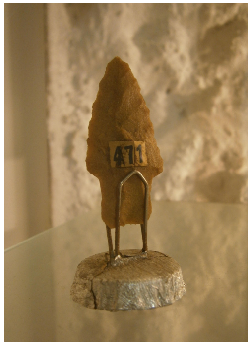
Figura 4. Material lítico con soporte realizado a partir de una chapita de botella y papel aluminio en un museo del departamento de Tacuarembó (año 2013).

Cabe señalar que con apoyo del SNM se instalaron sistemas de seguridad en varios museos dependientes del MEC entre los que se encuentran el Museo Histórico Nacional (Casa Rivera y Reservoirio y el depósito de colecciones) y el Nacional Antropológico.