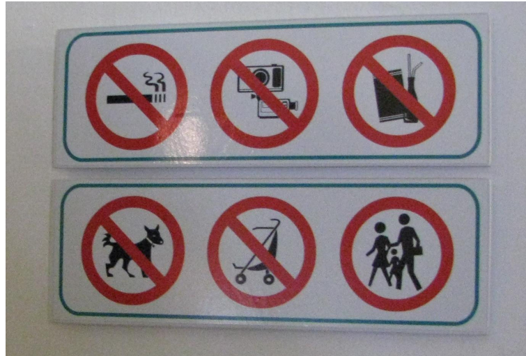
Figura 3. Cartelería convencional (según Mateos, 2011) de uno de los museos analizados (año 2013).

Por otro lado, el inmueble en el cual se emplaza el museo garantiza, según sus características, en mayor o menor medida, la conservación de las colecciones (RAMOS et al., 2000). En el relevamiento realizado, se categorizaron los inmuebles como: (a) casas museo o edificios históricos o (b) museos de nueva planta pensados desde el inicio para que los espacios sean operativos al desarrollo de todas las funciones (LINARES, 1994). Los museos comprendidos dentro del primer grupo generan una mayor complejidad en relación a las medidas y acciones de conservación a desarrollar, puesto que se trata de edificios antiguos, muchos de ellos con protección patrimonial que requiere de un mantenimiento constante y una limitante para la realización de obras de infraestructura. Sin embargo, poseen un valor patrimonial en sí mismos que atrae a los visitantes.